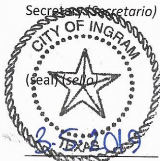
Date of adoption ( La fecha de adopción )